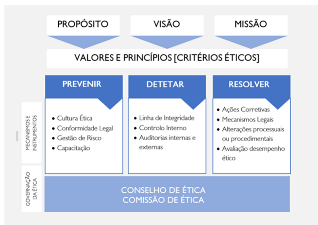
Figura I – Modelo de Integridade do Grupo AdP

Destaque-se ainda o facto de em 2021, no âmbito da implementação do modelo de integridade do Grupo AdP, ter sido aprovado, o já atrás referido, Regulamento de Denúncias Voluntárias de Irregularidades do Grupo AdP.