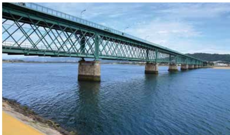
A ponte Eiffel é composta por dois tabuleiros metálicos, sendo o superior rodoviário e o inferior ferroviário, estando sobrepostos em 10 tramos. O vão mínimo entre pilares é de 46,08 m. A superestrutura da ponte é formada por duas vigas principais, retas e contínuas, com 7,50 m de altura