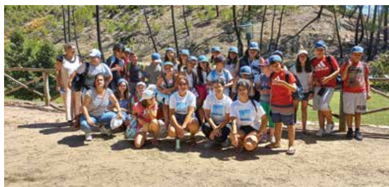
Praia Fluvial do Carvoeiro, em Mação