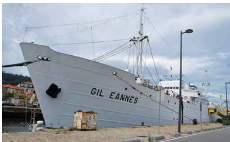
No dia 31 de janeiro de 1998, o navio hospital Gil Eanes foi recebido na foz do rio Lima, após uma campanha inédita de angariação de fundos, visando a sua aquisição. Depois de restaurado foi aberto ao público, assumindo-se como um novo espaço de memória de Viana do Castelo