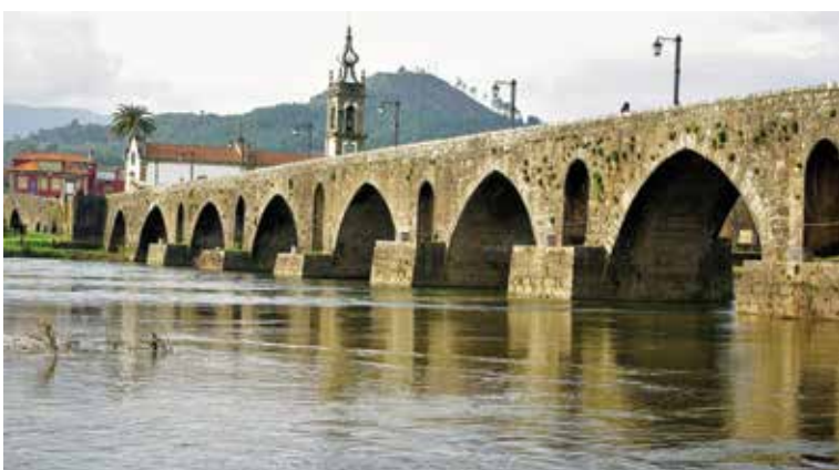
Imagem da ponte de Ponte de Lima. A travessia atual, reconstruída no século XIV, tem cerca de 380 metros de comprimento e é composta por 22 arcos, 15 dos quais medievais, construídos a partir de uma antiga ponte romana, onde restam 7 arcos apenas. É Monumento Nacional, desde 1910