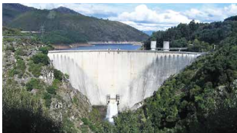
A barragem do Alto Lindoso, para além de produzir energia elétrica, assume uma função reguladora e evita variações bruscas no caudal do rio Lima. Tem a maior queda entre o nível da albufeira e a sala das turbinas (340 metros de profundidade), servida por um elevador, um dos mais altos e mais rápidos da Europa

“Os arcos erguidos, que o tempo estima, Sobre águas claras, cristais de fonte: Ponte Lima, O Lima, A ponte”. ●