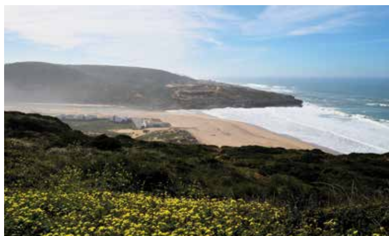
Vista parcial da Praia da Foz do Lizandro, onde o rio desagua no Oceano Atlântico. Em diferentes alturas do ano a sua barra encontra-se fechada por uma língua de areia, sendo necessária a abertura por meios mecânicos.