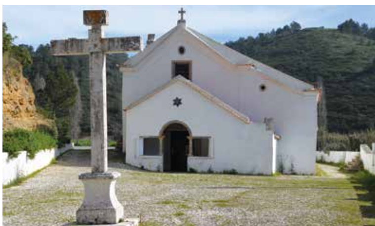
O topónimo "Senhora do Ó" encontra-se historicamente ligado ao rio Lizandro, dando nome à ponte e à igreja. Estes dois monumentos medievais encontram-se localizados no Vale da Carvoeira