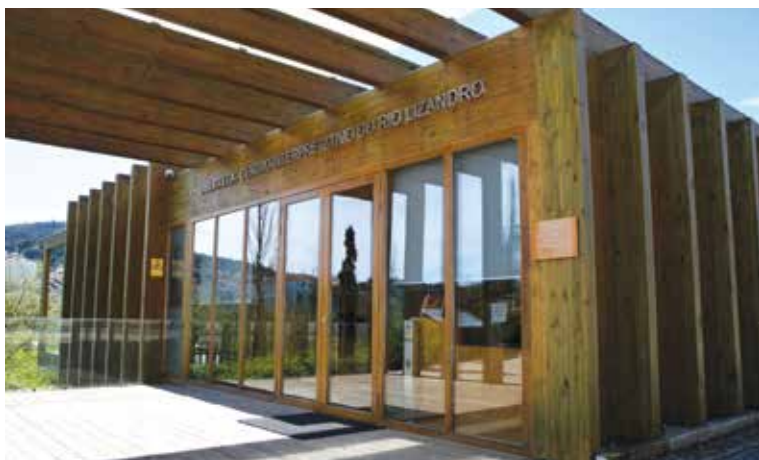
O Centro Interpretativo do Rio Lizandro desempenha um papel fundamental em termos de educação ambiental, apelando para a monitorização, reabilitação e sensibilização deste importante património natural, localizado no concelho de Mafra.

Antes de chegarem ao mar, solta-se uma voz Ainda que distantes, torneiam o último meandro. São águas passadas que se aproximam da foz. Não, não são do Tejo, mas sim do rio Lizandro. ●