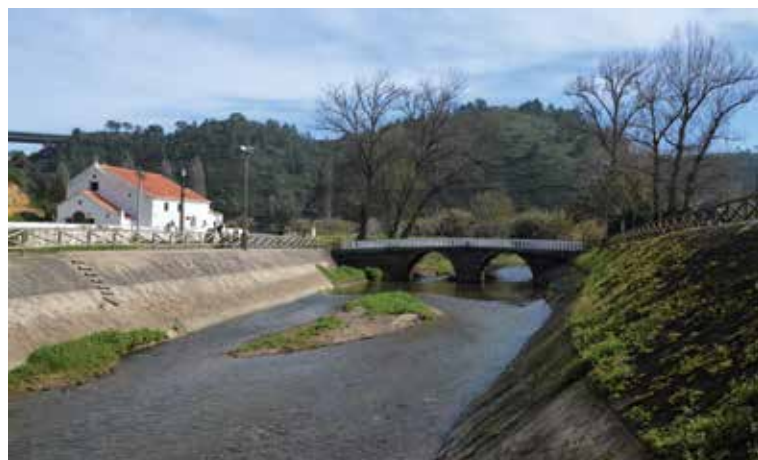
Ao longo dos séculos a igreja da "Senhora do Ó" sofreu várias alterações, muito em resultado da cíclicas cheias do rio Lizandro, que obrigaram a construção de um alto muro que a rodeia e a protege. O seu adro serviu de cemitério, entre 1585 até 1833